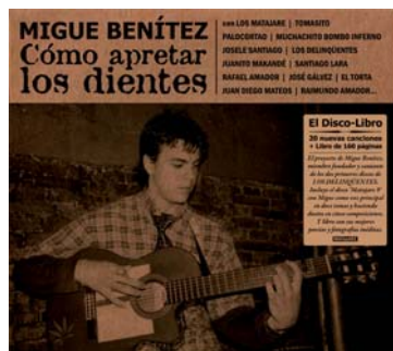
Portada 'Como Apretar los Dientes'